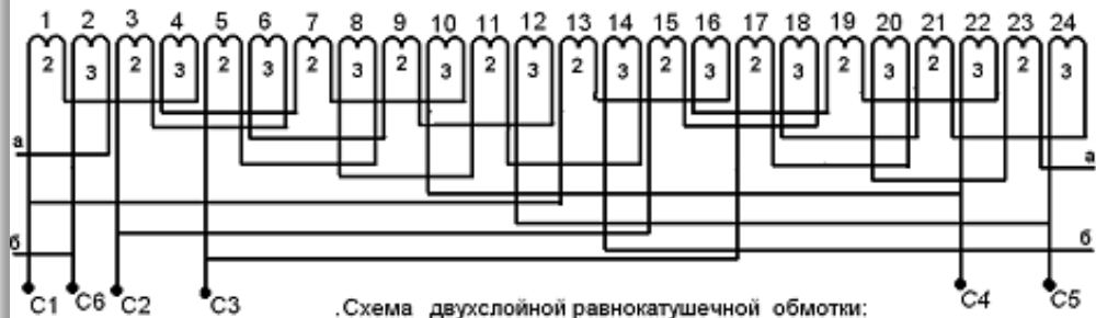
.Схема двухслойной равнокатушечной обмотки: 2p=8, Z=60, q=2 \text{ и } 3, u=1-7, a=2