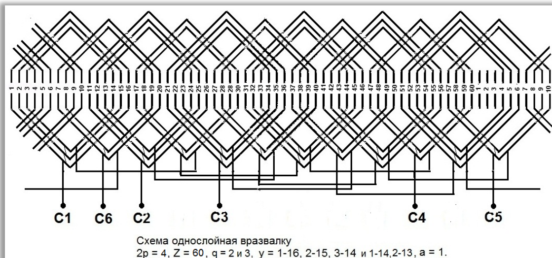
Схема однослойная вразвалку 2p = 4, Z = 60, q = 2 \text{ и } 3, y = 1-16, 2-15, 3-14 \text{ и } 1-14, 2-13, a = 1.